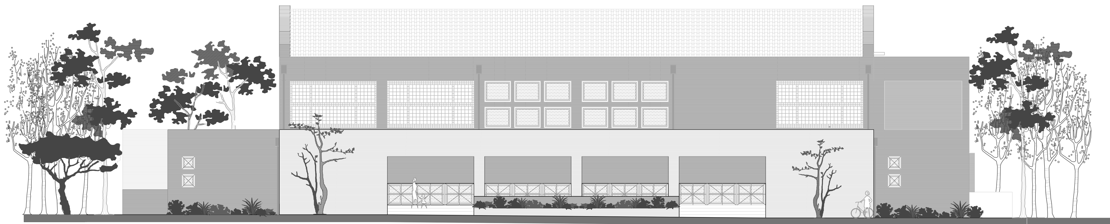
ΟΨΗ ΟΔΟΥ ΚΑΡΑΟΛΗ-ΔΗΜΗΤΡΙΟΥ