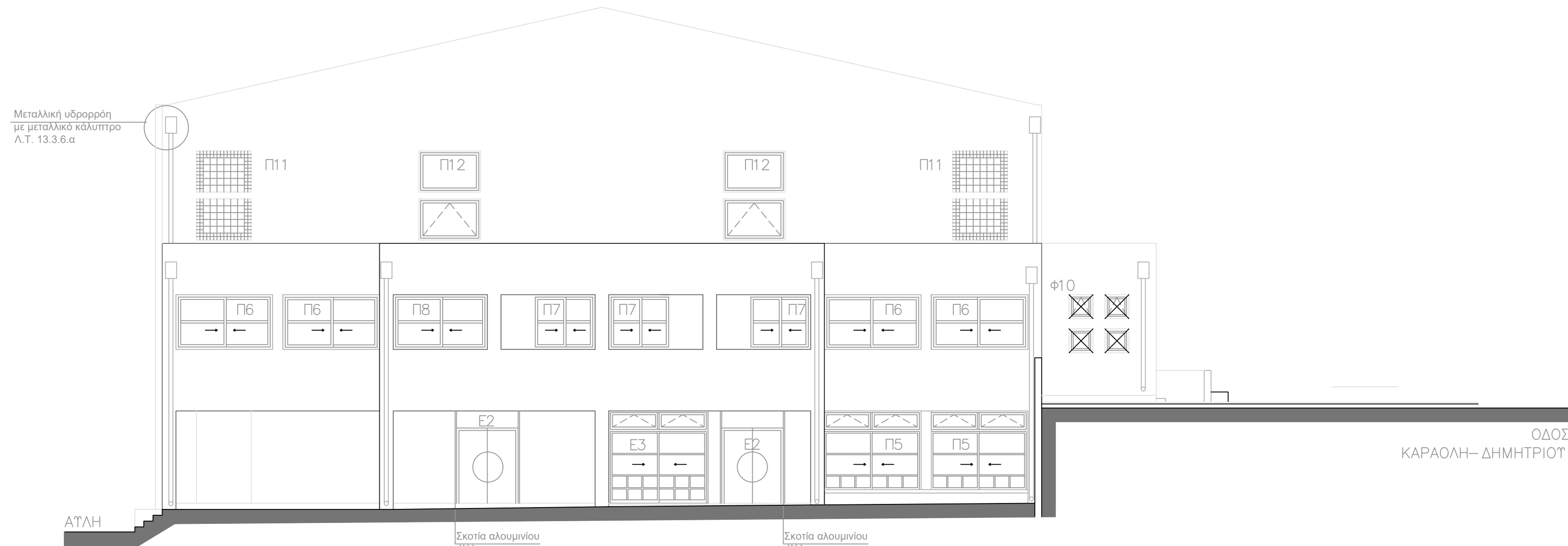
ΟΨΗ ΑΠΟ ΑΥΛΗ ΣΧΟΛΕΙΟΥ

Χρωματισμός εσωτερικών επιφανειών = 1.871,17 m 2